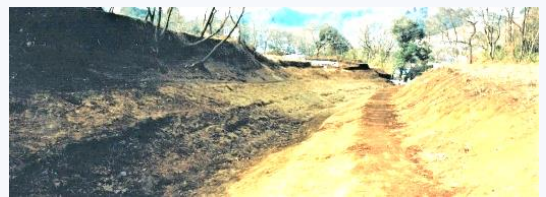
↑ 大規模な中世の道路遺構が出現

あの「 本町田行進曲 」が 盆踊り になりました!! 当日会場にて 初披露 します!!