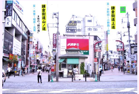
↑ 二つの鎌倉街道が合流するY字点 （戦国時代の原町田宿跡 ＝町田の東急前大通り）

総務省地域力創造アドバイザー／歴史古道まちづくりプランナー／(株)歴史シアター・ジャパン・代表取締役／歴史ルポライター／歴史古街道団・代表／鎌倉古道・歴史遺産の会 運営委員長／町田地方史研究会会員