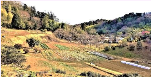
← 鎌倉街道や 関砦跡が残る 小野路の里山

関東特有の「鎌倉街道」の研究は、戦後の郷土史ブームを経て、現在では「現地に立った道路遺構の研究」や、様々な「科学的な方法での解析」が進みつつあります。最近では埼玉県では町田市と同じ路線の鎌倉街道がいよいよ「国指定史跡」となり、国分寺市では「市重要史跡」として市民が誇る歴史資産として、市民の誇る歴史資産として散策・健康ウォーキングや学習、観光などに大いに活用されています。