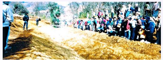
↑ 「野津田上の原遺跡」 発掘現場見学会1992年2月